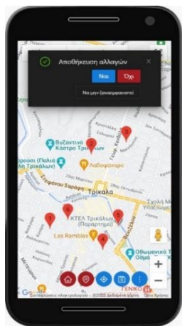
Σχήμα 1. Τοποθέτηση σημείων στον χάρτη

me.edu.gr/ ). Με την ολοκλήρωση των βημάτων παραμετροποίησης ενός σημείου, ο σχεδιαστής επιλέγει αν θέλει να αποθηκεύσει τις αλλαγές που έχει κάνει στο παιχνίδι.