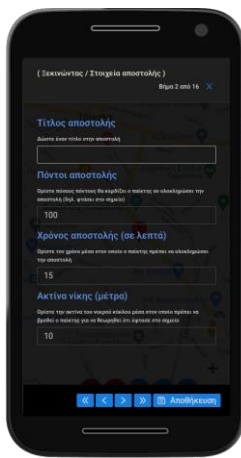
Σχήμα 2. Εισαγωγή στοιχείων αποστολής