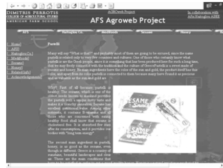
Σχήμα 2: Αρχική σελίδα της Αμερικανικής Γεωργικής Σχολής