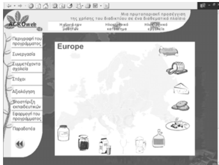
Σχήμα 1: Τα προϊόντα του AgroWeb