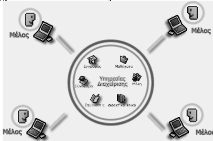
Εικόνα 1: Η πλατφόρμα υλοποίησης

δεδομένων αλλά και σε άλλες υπηρεσίες που παρέχονται μέσα από τον γενικότερο σχεδιασμό και την αρχιτεκτονική τους. Τα φυσικά πρόσωπα έχουν την δυνατότητα να χρησιμοποιήσουν τις υπηρεσίες του συστήματος μέσω του διαδικτύου και με την χρήση ενός προγράμματος ανάγνωσης ιστοσελίδων (browser). Ένα φυσικό πρόσωπο που έχει εξουσιοδοτηθεί να χρησιμοποιεί τις υπηρεσίες αυτές ονομάζεται μέλος της ψηφιακής εικονικής κοινότητας. Προϋπόθεση για να γίνει κάποιος μέλος, είναι η εξουσιοδότηση για την πρόσβαση στο σύστημα μέσω κωδικών ασφαλείας, με σκοπό να διασφαλιστεί η πρόσβαση στις πληροφορίες και την παροχή των υπηρεσιών, απαραίτητη προϋπόθεση για την στην διασφάλιση της ακεραιότητας των πληροφοριών που εισέρχονται και διακινούνται στο σύστημα.