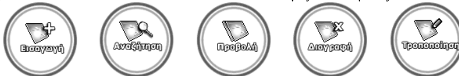
Εικόνα 4: Οι επιλογές διαχείρισης των πληροφοριών στην βάση δεδομένων

Οι πληροφορίες που υπάρχουν στο σύστημα είναι προσβάσιμες στα μέλη της ψηφιακής κοινότητας μέσω συγκεκριμένων ιστοσελίδων που παρέχουν τις κατάλληλες εντολές για την διαχείρισή τους. Αναλυτικά, υπάρχει ένα σύνολο πέντε βασικών λειτουργιών που υλοποιούνται στο πλαίσιο κάθε υπηρεσίας που παρέχεται από το σύστημα. Οι λειτουργίες αυτές είναι η εισαγωγή, η αναζήτηση, η προβολή, η διαγραφή και η τροποποίηση. Στο πλαίσιο κάθε υπηρεσίας και ανάλογα με την διαβάθμιση της, μόνο ένα υποσύνολο των εντολών αυτών είναι διαθέσιμες σε κάθε μέλος.