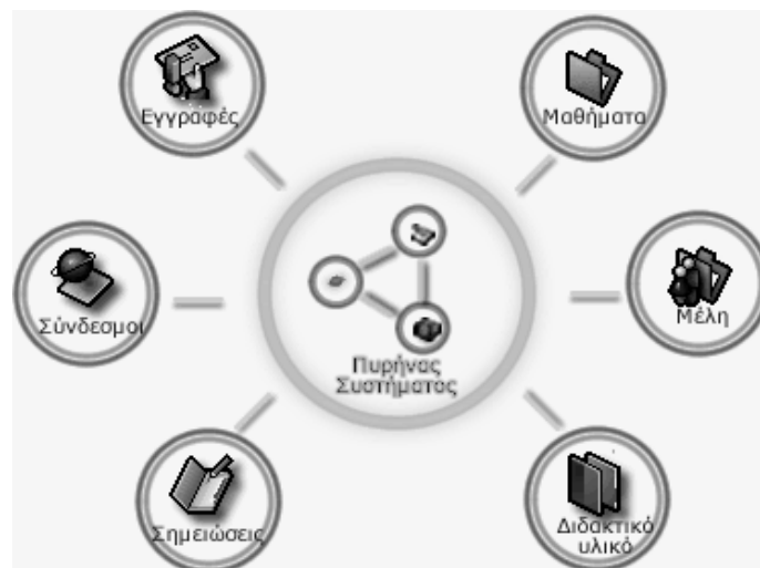
Εικόνα 3: Οι υπηρεσίες της ψηφιακής εικονικής κοινότητας

Στο ίδιο πλαίσιο της υποστήριξης των εκπαιδευτικών με δεδομένα και πληροφορίες που αξιοποιούνται στην εκπαιδευτική διαδικασία, είναι και η καταχώρηση συνδέσμων που αναφέρονται σε εκπαιδευτικούς δικτυακούς τόπους και ιστοσελίδες. Κάθε μέλος έχει την δυνατότητα να καταχωρήσει εκπαιδευτικούς συνδέσμους στον κεντρικό εξυπηρετητή κατατάσσοντας κάθε σύνδεσμο σε κατηγορίες, ανάλογα με το μάθημα -ή το αντικείμενο γενικότερα - στο οποίο αναφέρεται. Έτσι η καταχώρηση των εκπαιδευτικών συνδέσμων γίνεται με κριτήρια όπως το μάθημα στο οποίο απευθύνεται, οι λέξεις κλειδιά που βοηθούν στον προσδιορισμό της ενότητας στην οποία αναφέρεται και οι βοηθητικές σημειώσεις στις οποίες δίνονται με μεγαλύτερη λεπτομέρεια πληροφορίες για το περιεχόμενο του δικτυακού τόπου ή της ιστοσελίδας στην οποία οδηγεί ο σύνδεσμος. Τα μέλη όμως, εκτός από την δυνατότητα καταχώρησης συνδέσμων, μπορούν να αναζητήσουν συνδέσμους σύμφωνα με τα κριτήρια που αναφέραμε παραπάνω και κάνοντας κλικ στα αποτελέσματα της αναζήτησης να οδηγηθούν στον επιλεγμένο δικτυακό τόπο ή την ιστοσελίδα.