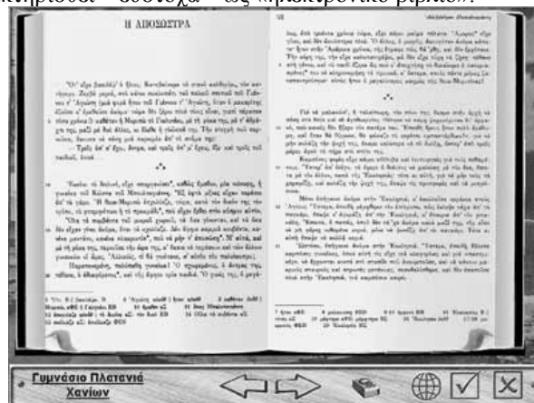
Εικόνα 3 : Το πρωτότυπο κείμενο της "Αποσώστρας"

Μετά την ολοκλήρωση της δράσης και τη δημιουργία του τελικού προϊόντος εξετάσαμε το αν και κατά πόσο αυτό θα ωφελούσε να χρησιμοποιηθεί ως εκπαιδευτικό λογισμικό στην ενότητα Αλ. Παπαδιαμάντης των Νέων Ελληνικών της Β' Γυμνασίου. Η προοπτική όμως αυτή, της εφαρμογής που δημιουργήσαμε με τη δράση, δεν θα μπορούσε να ευδοκμήσει μιας και η εφαρμογή στερείται αρκετών στοιχείων διαδραστικότητας και αλληλεπίδρασης με το μαθητή, με αποτέλεσμα να μην μπορεί δημιουργήσει περιβάλλον διερευνητικής μάθησης, έτσι ώστε ο μαθητής – μέσα από κατάλληλες διαδραστικές δραστηριότητες – να «ανακαλύψει» τη γνώση. Μπορεί λοιπόν να χαρακτηριστεί – εύστοχα – ως «ηλεκτρονικό βιβλίο».