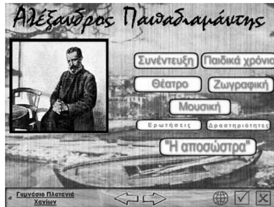
Εικόνα 1: Η κεντρική οθόνη της εφαρμογής

Το δεύτερο είναι αφιερωμένο στο κείμενο της «Αποσώστρας» και παρουσιάζει : Το πρωτότυπο κείμενο, παράλληλα κείμενα, ερωτήσεις, δραστηριότητες και μια ταινία σκίτσων που στηρίζεται στη θεατρική διασκευή των μαθητών στο κείμενο της «Αποσώστρας»