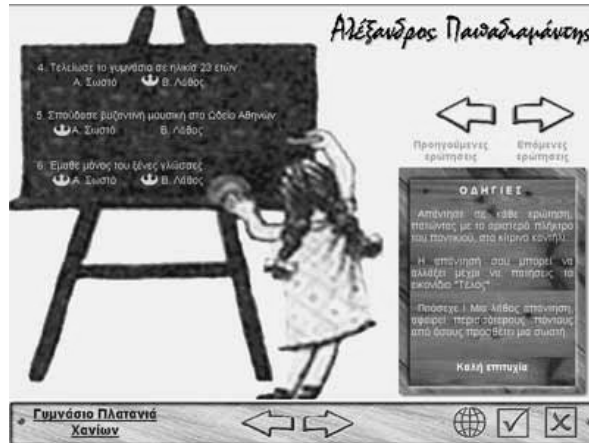
Εικόνα 2: Η περιοχή των «Ερωτήσεων»