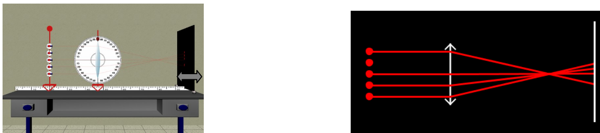
Εικόνα 2. Συζευγμένοι χώροι «Κόσμου» και «Μοντελοχώρου»

Στο παράθυρο του « Μοντελοχώρου » εμφανίζεται η σχηματική αναπαράσταση της πειραματικής διάταξης (μοντέλο του πειράματος) όπως θα σχεδιάζονταν στον μαυροπίνακα της τάξης. Όμως, η σχηματική αναπαράσταση δεν αποτελεί στατική εικόνα, όπως στον μαυροπίνακα, αλλά είναι δυναμικά συνδεδεμένη με την πειραματική διάταξη του « Κόσμου ». Έτσι, η σχηματική αναπαράσταση μεταβάλλεται δυναμικά καθώς ο χρήστης συνθέτει, τροποποιεί ή αναπροσαρμόζει την πειραματική διάταξη. Η απεικόνιση του εργαστηριακού πειράματος ως μοντέλο βοηθά τους μαθητές να συνδέσουν την εικόνα ενός «ρεαλιστικού κόσμου» (εργαστήριο) με τα νοητικά μοντέλα και τις σχηματικές αναπαραστάσεις τους. Στην Εικόνα 2