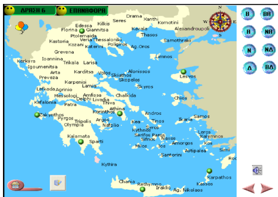
Εικόνα 4: Θόνη προσανατολισμού στο χάρτη

Η δραστηριότητα αυτή εμπεριέχει ένα παιχνίδι που έχει ως σκοπό να καλλιεργήσει την ικανότητα προσανατολισμού με τη βοήθεια του χάρτη.