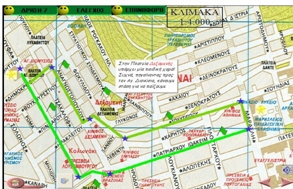
Εικόνα 5: Η θόνη της επίσκεψης σε γειτονικό σχολείο

Έτσι πρέπει να λάβουν υπόψη τους τις εξής παραμέτρους: α) την απόσταση: η μία διαδρομή είναι συντομότερη της άλλης, β) το χρόνο: οι μαθητές πρέπει να βρεθούν συγκεκριμένη ώρα στο σχολείο επίσκεψης και να επιστρέψουν συγκεκριμένη ώρα στο σχολείο τους, και γ) τα ενδιαφέροντα σημεία κάθε μιας διαδρομής σε συσχετισμό με το χρόνο που απαιτείται για να τα επισκεφτούν.