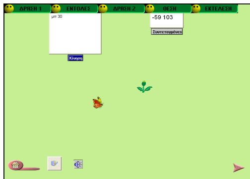
Εικόνα 1: Οθόνη ορισμού θέσης σημείου στο επίπεδο

Επιδίωξη της συγκεκριμένης δραστηριότητας είναι να έρθουν στην επιφάνεια οι διαισθητικές ιδέες των παιδιών, που σχετίζονται με το γεγονός ότι, για να ορίσουμε ένα σημείο στο επίπεδο, αρκεί να γνωρίζουμε την απόστασή του από ένα οριζόντιο και ένα κάθετο άξονα.