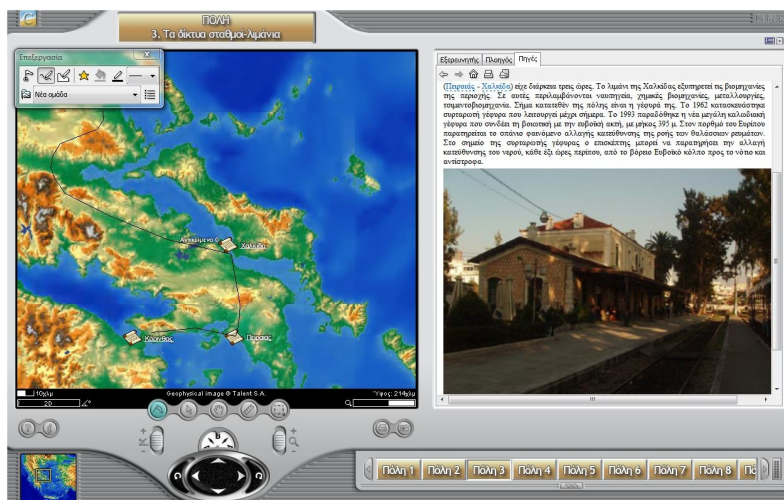
Εικόνα 2: «Κανάλι» Πόλη 3: Πώς συνδέονται οι πόλεις: οι σταθμοί και τα λιμάνια

Στη συνέχεια οι μαθητές με τη βοήθεια των εργαλείων του περιβάλλοντος σχεδιάζουν τη διαδρομή του ταξιδιού σημειώνοντας τους σταθμούς που προτείνουν, εκτυπώνουν το διαμορφωμένο χάρτη που τους ζητήθηκε και γράφουν το γράμμα στο Marco, επιλέγοντας να του παρουσιάσουν εκείνες τις πληροφορίες που οι ίδιοι θεωρούν σημαντικές και ενδιαφέρουσες για το ταξίδι του. Ο/η εκπαιδευτικός ενθαρρύνει τη δημιουργική φαντασία των μαθητών, απαντά στα ερωτήματα που προκύπτουν και υποστηρίζει την αναζήτηση πρόσθετων πληροφοριών από άλλα γνωστικά αντικείμενα.