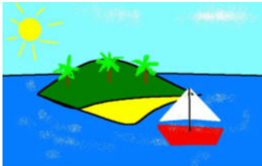
Σχήμα 1. Βραβευμένο έργο παιδιού με κινητικά προβλήματα από το Φυσιοθεραπευτήριο Ειδικής Αγωγής Κορίνθου

τάξη. Στο ρόλο του δίαυλου επικοινωνίας και διασύνδεσης οι η/υπολογιστές των σχολικών μονάδων.