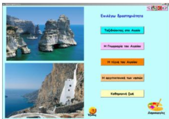
Σχήμα 1. Η κεντρική φόρμα της εφαρμογής