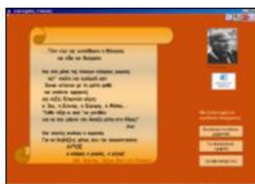
Σχήμα 3. Ελύτης «Η Γένεσις»