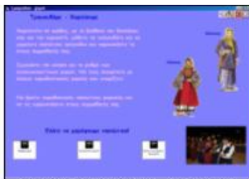
Σχήμα 5. Τραγουδάμε - χορεύουμε