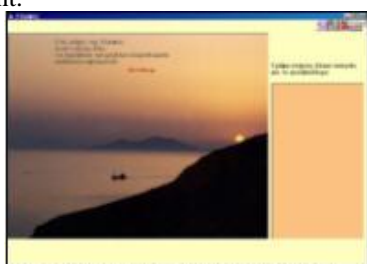
Σχήμα 2. Ηλιοβασίλεμα στη Σέριφο

Το ταξίδι συνεχίζεται και σε κάθε σταθμό πλέον, εμφανίζονται στο αριστερό άκρο της οθόνης στίχοι οι οποίοι, όταν το караβάκι φτάσει στο τέλος του ταξιδιού, μας δίνουν ολοκληρωμένο το ποίημα του Κ. Βάρναλη: «Να σ' αγναντεύω θάλασσα». Διαβάζουν το ποίημα του Βάρναλη (από το καινούριο ανθολόγιο της Ε' και ΣΤ' Δημοτικού) και εργάζονται με σχετικές δραστηριότητες σε Word και Paint.