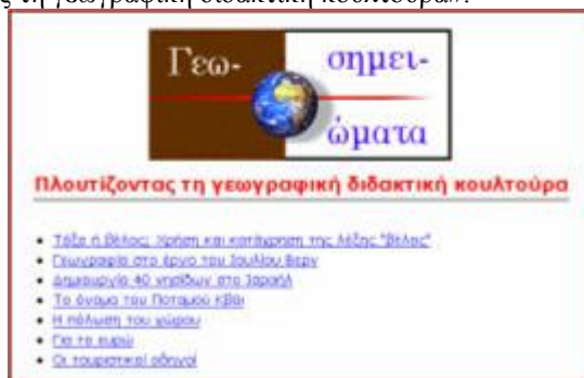
Εικ. 3. Από τη σελίδα «Γεωσημειώματα»

Παρόμοιος πίνακας συγκεντρωμένων θεμάτων υπάρχει και σε άλλη θέση με μερικά μικρότερα «γεωσημειώματα» –παρουσιάζονται μερικοί τίτλοι στην εικ. 3– με τον επεξηγηματικό υπότιτλο «Πλουτίζοντας τη γεωγραφική διδακτική κουλτούρα»: