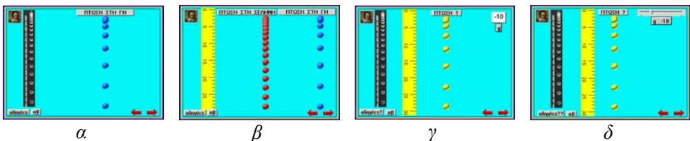
Σχήμα 2: Στιγμιότυπα μικρόκοσμων από εργασία μαθητών