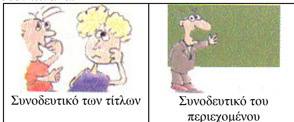
Σχήμα 2: Χαρακτηριστικά Clip Arts

Τα γυναικεία πρότυπα, είτε θετικά είτε αρνητικά, απουσιάζουν από το εγχειρίδιο. Δεν υπάρχουν εικόνες που μπορούν να σχολιαστούν και στα Clip Arts (Σχήμα 2), υπάρχει αρχικά ισοκατανομή μαθητών και μαθητριών σε αυτά που συνοδεύουν τους τίτλους, ενώ το Clip Art που συνοδεύει την ανάπτυξη του περιεχομένου, περιλαμβάνει τον άνδρα καθηγητή στον πίνακα.