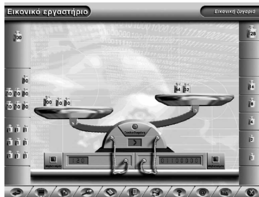
Σχήμα 1. Η διεπιφάνεια χρήσης του Εικονικού εργαστηρίου «Εικονική ζυγαριά»

Στην έρευνα χρησιμοποιήθηκε ο μικρόκοσμος της «εικονικής ζυγαριάς» του ΔΕΛΥΣ (Dagdilelis et al., 2002) (Σχήμα 1). Πρόκειται για ένα εικονικό εργαστήριο, το οποίο σχεδιάστηκε προκειμένου οι μαθητές να κατανοήσουν τη σχέση μεταξύ του δυαδικού αριθμητικού συστήματος (δεξιάς δίσκος) και του δεκαδικού αριθμητικού συστήματος (αριστερός δίσκος), μέσω μιας «ζυγαριάς», η οποία ισορροπεί όταν οι αριθμοί που αναπαρίστανται στο αριστερό και στο δεξί δίσκο της έχουν ίση αξία.