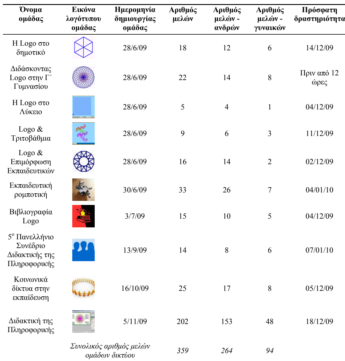
Πίνακας 1: Στοιχεία ομάδων δικτύου (τελευταία ενημέρωση 13/1/2010 9:35:00 πμ)

Σημειώνεται ότι το ελληνικό δίκτυο «Η Logo στην εκπαίδευση: Μια κοινότητα πρακτικής και μάθησης» (Σχήμα 2) επιλέχθηκε για περαιτέρω μελέτη καθώς α) αφορά κυρίως τους καθηγητές/τριες Πληροφορικής, τη διδασκαλία και τη Διδακτική της Πληροφορικής, αλλά παράλληλα και τους/τις εκπαιδευτικούς όλων των ειδικοτήτων που ενδιαφέρονται για την αξιοποίηση της γλώσσας