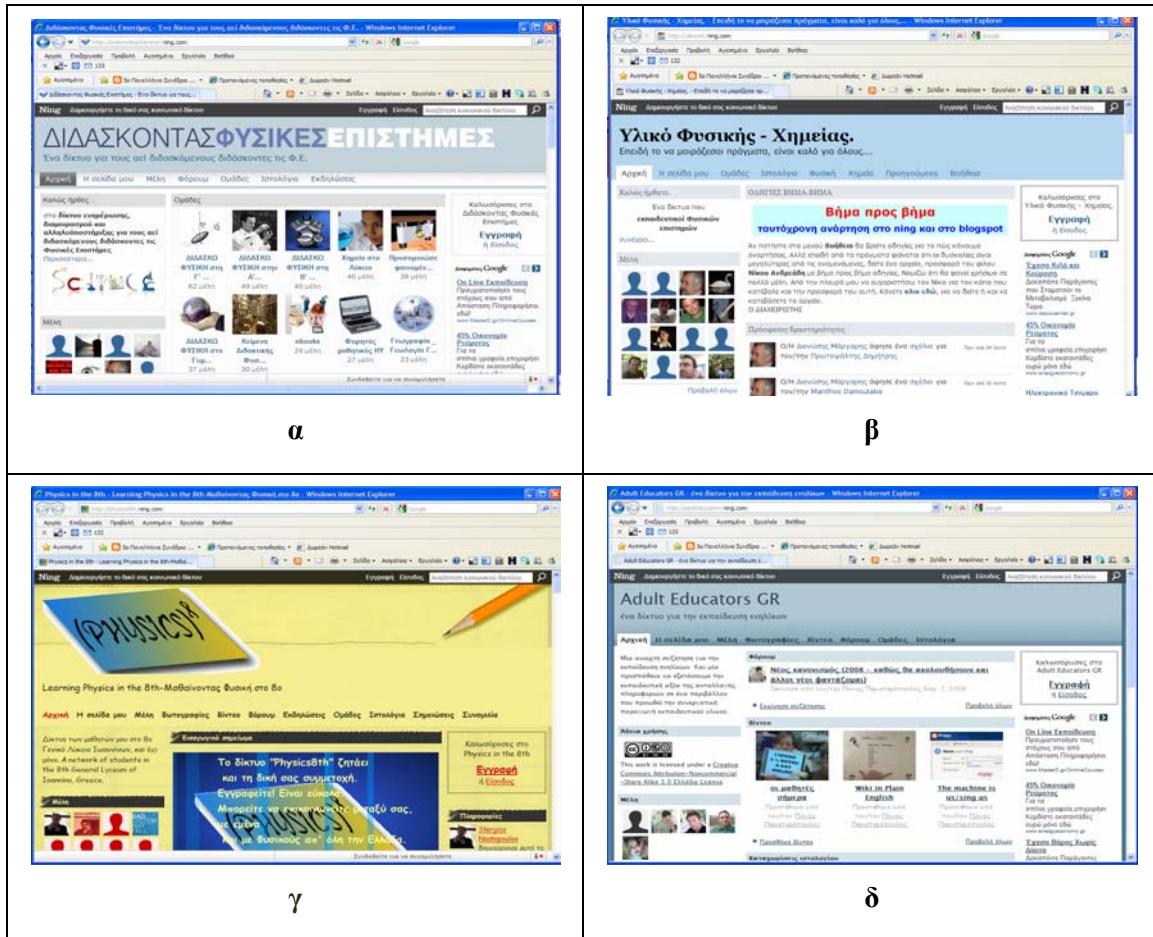
Σχήμα 1: Στιγμιότυπο της κεντρικής σελίδας των ιστότοπων των κοινωνικών δικτύων: α) «Διδάσκοντας Φυσικές Επιστήμες», β) «Υλικό Φυσικής και Χημείας», γ) «Μαθαίνοντας Φυσική στο 8ο» και δ) «Adult Educators GR»

Το δίκτυο αυτό στις 13/11/2009 12:37 μμ αριθμεί τα 285 μέλη και ο αριθμός των ομάδων ανέρχεται σε εννέα. Από την διερεύνηση του δικτυακού τόπου διαπιστώνουμε ότι στην πλειοψηφία τους οι περισσότερες ομάδες είναι πολύ ενεργές με πλήθος συζητήσεων, καταχωρίσεων, σχολιασμών και ανάρτηση εκπαιδευτικού υλικού όπως φύλλα εργασίας, ασκήσεις, απαντήσεις ασκήσεων. Τα μέλη αναπτύσσουν έντονο διάλογο, συνεργασία, ανταλλαγή απόψεων και υλικού. Τέσσερις στις εννέα ομάδες εμφανίζουν εντονότατη πρόσφατη τελευταία δραστηριότητα. Έξι στις εννέα ομάδες εστιάζουν σε γνωστικά αντικείμενα ανά τάξη. Η ομάδα «Φυσική Γ΄ Λυκείου» είναι η πιο μαζική ομάδα, γεγονός που επίσης ερμηνεύεται λόγω του έντονου ενδιαφέροντος και της ανάγκης αλληλοϋποστήριξης των καθηγητών και μαθητών λόγω των επερχόμενων πανελλαδικών εισαγωγικών εξετάσεων για την τριτοβάθμια εκπαίδευση, όπως προαναφέρθηκε και στο προηγούμενο παράδειγμα δικτύου. Το δίκτυο «Υλικό Φυσικής - Χημείας» είναι το δεύτερο δίκτυο σε μαζικότητα σε σύγκριση με τα άλλα ελληνικά ΔΕΚΔ και εμφανίζει πλούσια δραστηριότητα μελών.