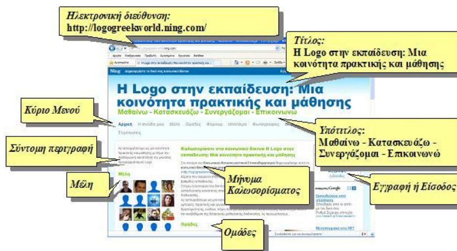
Σχήμα 2: Στιγμιότυπο της κεντρικής σελίδας του ιστότοπου του κοινωνικού δικτύου «Η Logo στην εκπαίδευση»

Το κοινωνικό δίκτυο «Η Logo στην εκπαίδευση: Μια κοινότητα πρακτικής και μάθησης» ( http://logogreekworld.ning.com/ ) με υπότιτλο: «Μαθαίνω – Κατασκευάζω – Συνεργάζομαι – Επικοινωνώ» δημιουργήθηκε από μία καθηγήτρια Φυσικής/Πληροφορικής στα τέλη Μαΐου 2009 στην πλατφόρμα Ning. Σκοπό του δικτύου αποτελεί η επικοινωνία, η συνεργασία, και η ανταλλαγή ιδεών, απόψεων και υλικού μεταξύ των μελών της εκπαιδευτικής κοινότητας σχετικά με θέματα που αφορούν κυρίως στην παιδαγωγική αξιοποίηση της γλώσσας προγραμματισμού Logo και των Logo-like περιβαλλόντων στην εκπαίδευση. Στόχος η λειτουργία του δικτύου ως κοινότητα πρακτικής και μάθησης, ως βήμα διαλόγου και αλληλοϋποστήριξης της εκπαιδευτικής κοινότητας στην προσπάθεια