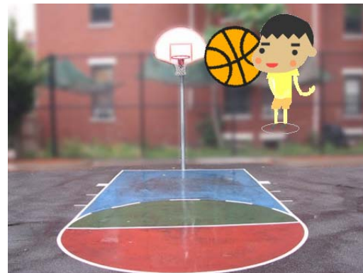
(β) Στιγμιότυπο οθόνης