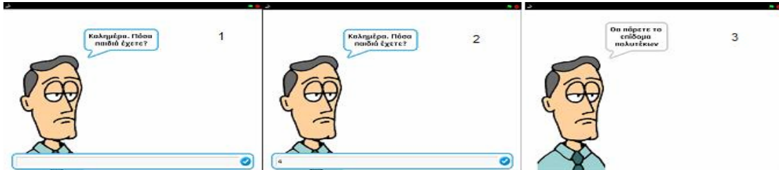
Σχήμα 2: Ροή εκτέλεσης αλγορίθμου – 1 ο Παράδειγμα

Οι μαθητές μπορούν να πειραματιστούν ελεύθερα με την εκτέλεση του αλγορίθμου και την αλληλεπίδραση με τον χαρακτήρα του Σχήματος 2. Επίσης μπορούν να αλλάξουν τη σειρά, αλλά και τις ιδιότητες των πλακιδίων, έτσι ώστε να παρατηρήσουν τις αλλαγές στον αλγόριθμο και να δοθεί αφορμή για συζήτηση και διάλογο. Δίπλα από τις εντολές του σεναρίου υπάρχουν επεξηγηματικές παρατηρήσεις (Σχήμα 1).