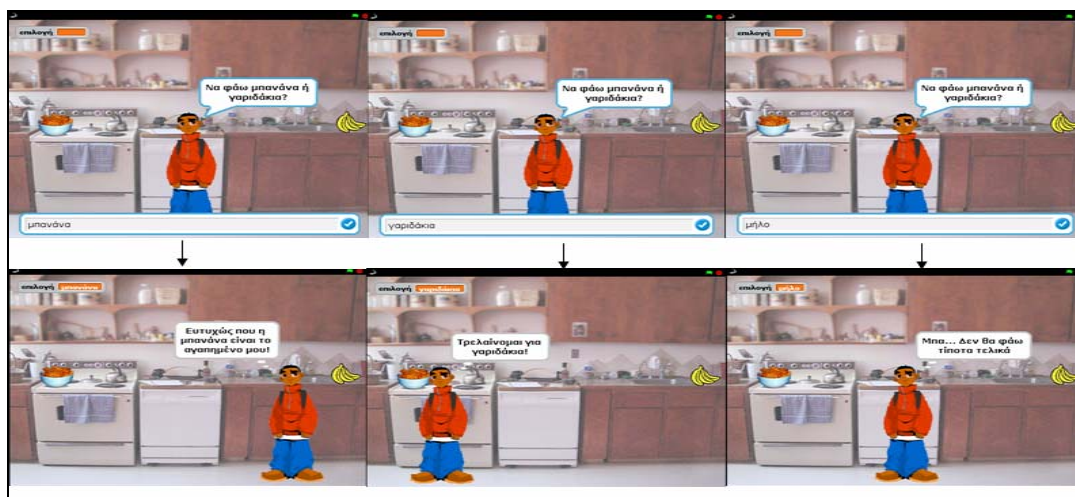
Σχήμα 6: Η εκτέλεση του αλγορίθμου του 3 ου Παραδείγματος και για τις 3 περιπτώσεις

Το τρίτο και τελευταίο παράδειγμα (Σχήμα 5, Σχήμα 6), πραγματεύεται την εισαγωγή των μαθητών στη Δομή Πολλαπλής Επιλογής. Σε αυτή τη δραστηριότητα οι μαθητές πρέπει να βάλουν στη σειρά τις εντολές, έτσι ώστε να σχηματιστεί αλγόριθμος ο οποίος: θα εμφανίζει στην οθόνη την ερώτηση του χαρακτήρα: «Να φάω μπανάνα ή γαριδάκια;». Ανάλογα με την επιλογή του χρήστη να κινείται ή όχι ο χαρακτήρας προς το φαγητό που πρέπει και να εμφανίζεται στην οθόνη η κατάλληλη «σκέψη» του. Η πολλαπλή επιλογή AN... ΑΛΛΙΩΣ_ΑΝ γίνεται με εμφωλευμένες AN... ΤΟΤΕ...ΑΛΛΙΩΣ.