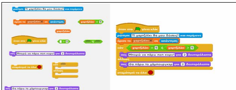
Σχήμα 3: Δραστηριότητα τοποθέτησης πλακιδίων στη σωστή σειρά – 2 ο Παράδειγμα αλγορίθμου

Οι μαθητές μπορούν να πειραματιστούν ελεύθερα με την εκτέλεση του αλγορίθμου και την αλληλεπίδραση με τον χαρακτήρα του Σχήματος 2. Επίσης μπορούν να αλλάξουν τη σειρά, αλλά και τις ιδιότητες των πλακιδίων, έτσι ώστε να παρατηρήσουν τις αλλαγές στον αλγόριθμο και να δοθεί αφορμή για συζήτηση και διάλογο. Δίπλα από τις εντολές του σεναρίου υπάρχουν επεξηγηματικές παρατηρήσεις (Σχήμα 1).