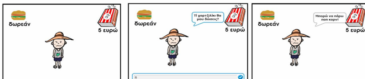
Σχήμα 4: Αλληλουχία εκτέλεσης εντολών όταν η συνθήκη (χαρτζιλίκι > 5) είναι αληθής – 2 ο Παράδειγμα

Το δεύτερο παράδειγμα αφορά την παρουσίαση της Συνθετής Δομής Επιλογής (ΑΝ...ΤΟΤΕ... ΑΛΛΙΩΣ), όπου η δομή ελέγχου έχει εντολές που πρέπει να πραγματοποιηθούν και για τις δύο τιμές της λογικής συνθήκης. Δίνεται στους μαθητές το εξής πρόβλημα (Σχήμα 3): «Τοποθετήστε στη σωστή σειρά τις εντολές, ώστε να σχηματιστεί αλγόριθμος που θα δέχεται σαν είσοδο το χαρτζιλίκι του εικονιζόμενου χαρακτήρα και θα εκτυπώνει στην οθόνη μήνυμά του, το οποίο αναφέρει το φαγητό που μπορεί να αγοράσει (Σχήμα 4), ανάλογα με τα διαθέσιμα χρήματα». Η εκφώνηση αποτελεί παραλλαγή του ΔΤ2-Δ της σελίδας 78, και ΔΤ5 της σελίδας 22, του τετραδίου του μαθητή.