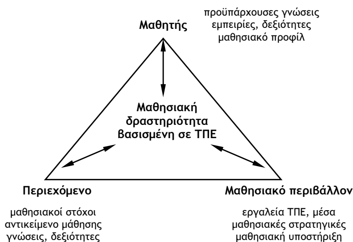
Σχήμα 2. Το πλαίσιο σχεδιασμού μαθησιακών δραστηριοτήτων ΦΕ βασισμένων σε ΤΠΕ

Ο σχεδιασμός μιας μαθησιακής δραστηριότητας για τις ΦΕ, στα πλαίσια της εργασίας των επιμορφούμενων, περιλάμβανε τις εξής φάσεις: