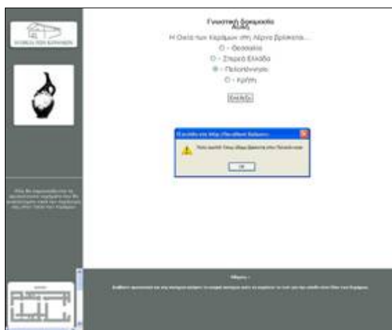
Σχήμα 2. Γνωστική δοκιμασία (ερωτήσεις πολλαπλών επιλογών)