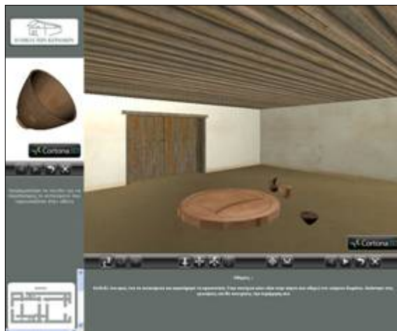
Σχήμα 1. Περιβάλλον διεπαφής εφαρμογής

επιλογών κλιμακούμενης δυσκολίας (Σχήμα 2). Το περιεχόμενο των ερωτήσεων σχετίζεται με το αντίστοιχο επίπεδο και τα αντικείμενα που περιλαμβάνονται σε αυτό. Αν ο χρήστης απαντήσει σωστά συνεχίζει την περιήγηση του στον επόμενο χώρο. Αν απαντήσει λάθος μπορεί να προσπαθήσει ξανά. Ειδικότερα, προκειμένου να εξερευνηθεί όλους του εικονικούς χώρους του περιβάλλοντος και να καταφέρει να εντοπίσει το χρυσό σκεύος, πρέπει να αντιμετωπίσει έξι γνωστικές δοκιμασίες και ένα σύνολο δεκατριών ερωτήσεων από τις οποίες οι δύο τελευταίες εξετάζουν την κατανόηση της συνολικής λειτουργίας του κτηρίου και της περιόδου.