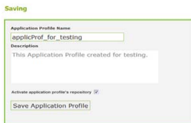
Σχήμα 3. Η αποθήκευση του νέου ΠΕ στο Μητρώο των ΠΕ του ASK-LOMAP