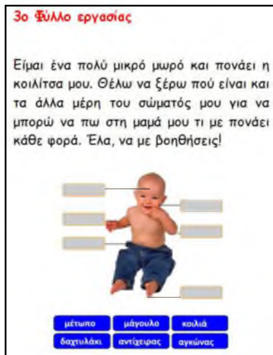
Εικόνες 6,7: Φύλλα Εργασίας