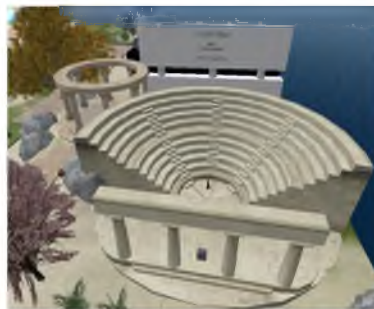
Εικόνα 1: Το πρώτο κτίριο της Ακαδημίας Αθηνών στο SL

Αρχικά η Ακαδημία για τη στέγασή της χρησιμοποίησε ένα κτίριο που είχε τη μορφή αρχαίου θεάτρου, το οποίο αγοράστηκε μέσα από τον κόσμο του SL (Εικόνα 1).