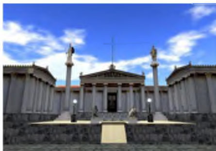
Εικόνα 2: Το νέο κτίριο της Ακαδημίας Αθηνών στο SL