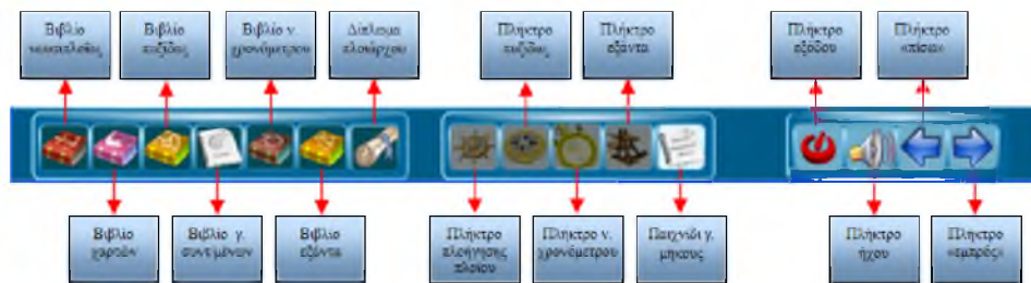
Εικόνα 1: Η γραμμή αντικειμένων - εργαλείων του λογισμικού (object - toolbar)

Η υπερμεσική εφαρμογή «Περίπλους» κατασκευάστηκε εξ ολοκλήρου με το συγγραφικό πακέτο δόμησης υπερμέσων Flash. Η δόμηση του περιεχομένου της εφαρμογής βασίζεται στο σενάριο του εικονικού ταξιδιού ενός παιδιού που υποστηρίζεται σταδιακά με ιστορικά όργανα Ναυσιπλοΐας για να το ολοκληρώσει (εικ. 1).