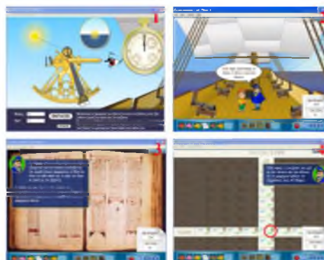
Εικόνα 4: Διαδικασία εύρεσης γεωγραφικού πλάτους με χρήση εξάντα και ν. χρονόμετρου