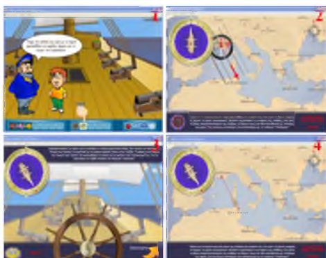
Εικόνα 3: Προσανατολισμός και χάραξη πορείας με εικονική χρήση πυξίδας