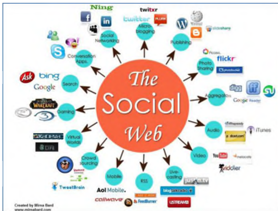
Σχήμα 1: Κατηγορίες μέσων κοινωνικής δικτύωσης κατά Bard

Με αφορμή αυτή την κατηγοριοποίηση και λαμβάνοντας υπόψη ότι υπάρχουν 1,2 εκατομμύρια ανακοινώσεις σε ιστολόγια (blogs, micro blogs κλπ.) ενώ κάθε μέρα το 45% των ενήλικων χρηστών του διαδικτύου δημιουργεί κάποιο δικό του «προϊόν» στο διαδίκτυο, ο χώρος των μέσων κοινωνικής δικτύωσης είναι ένα δυναμικά και ταχύτατα αναπτυσσόμενο πεδίο, ιδιαίτερα ελκυστικό και για τις επιχειρήσεις, καθώς ανοίγει νέες πολύπλευρες δυνατότητες για τους καταναλωτές και αλλάζει το χάρτη της αγοράς.