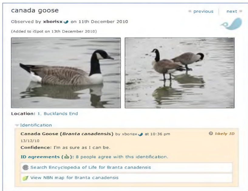
Εικόνα 2: Διαμοιρασμός φωτογραφικού υλικού από εκπαιδευόμενο και έλεγχος εγκυρότητας από την κοινότητα

Για τη διασφάλιση της ποιότητας και της εγκυρότητας του περιεχομένου, πολυμελής επιστημονική ομάδα του Ανοικτού Πανεπιστημίου παρακολουθεί την εισαγωγή νέων δεδομένων στην ιστοσελίδα, ελέγχει και διορθώνει ανάλογα. Όπως φαίνεται και από την ακόλουθη εικόνα, ο χρήστης ανεβάζει στην ιστοσελίδα τη φωτογραφία που επιθυμεί, δηλώνοντας παράλληλα την ονομασία του εικονιζόμενου είδους.