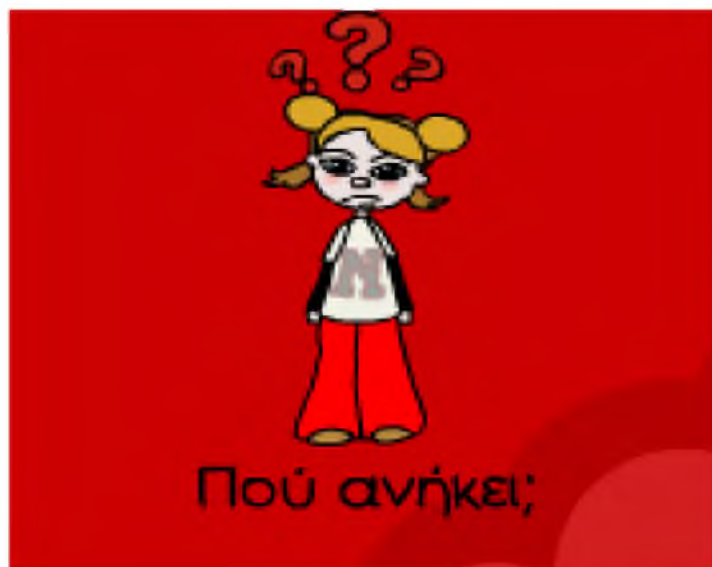
Εικόνα 1: Το παιχνίδι «Πού ανήκει;», το οποίο χρησιμοποιήθηκε.

Προκειμένου να πραγματοποιηθεί η συγκεκριμένη έρευνα χρειαστήκαμε ένα laptop, το οποίο θα χρησιμοποιούσαν τα παιδιά και μια εφαρμογή ενός ηλεκτρονικού παιχνιδιού. Ως παιχνίδι επιλέχτηκε το «Πού ανήκει;», μια εφαρμογή που ζητούσε από τα παιδιά να μετακινούν αντικείμενα σύροντάς τα από μια θέση σε μια άλλη, είτε με το ποντίκι είτε με την οθόνη αφής.