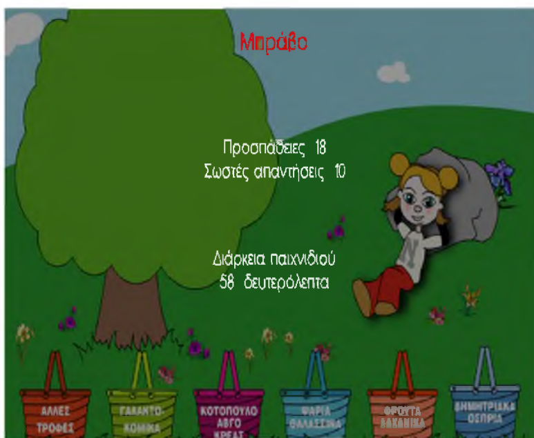
Εικόνα 3: Διάρκεια και αποτελέσματα του παιχνιδιού.

Η συλλογή δεδομένων αφορούσε τις επιδόσεις των παιδιών στο συγκεκριμένο παιχνίδι και στο χρονικό όριο που του είχαμε θέσει. Αρχικά καταγράψαμε πόσα τρόφιμα κατάφερε το παιδί να βάλει στα καλάθια που του δίνονταν σε διάστημα δυο λεπτών, χωριστά με την χρήση της οθόνης αφής και χωριστά με χρήση του ποντικιού.