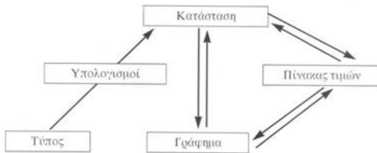
Σχήμα 1. Επίλυση προβλήματος αναλογίας

Ο "Δημιουργός Μοντέλων" προτείνει ένα περιβάλλον εργασίας εμπλουτισμένο με αντικείμενα που θα παίζουν ένα ενδιάμεσο (transitional) ρόλο βοηθώντας στο νοητικό χειρισμό εκ μέρους των μαθητών αφηρημένων αντικειμένων ή εννοιών. Λειτουργεί καταυτό τον τρόπο ως πέρασμα από τη διαισθητική στη φορμαλιστική μάθηση. Η προσέγγιση της έννοιας της αλληλεξάρτησης μεταξύ μεγεθών γίνεται καταρχήν με ποιοτικό τρόπο ενώ στη συνέχεια το λογισμικό επιτρέπει το πέρασμα στον ποσοτικό συλλογισμό τόσο με τη χρήση πινάκων αντίστοιχων τιμών όσο και με τη χρήση αλγεβρικής μοντελοποίησης και γραφικών παραστάσεων (Σχήμα 1).