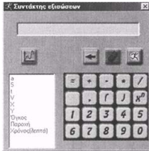
Σχήμα 4. Συντάκτης εξισώσεων

Στο Σχήμα 4 ο συντάκτης περιέχει και τις ιδιότητες που συμμετέχουν στο μοντέλο H βρύση και το βαρέλι . Μπορούμε συνεπώς να δημιουργήσουμε μαθηματικές σχέσεις χρησιμοποιώντας αυτές τις ιδιότητες, όπως π.χ. \text{χρόνος(λεπτά)}=5*\text{όγκος} . Αφού δημιουργήσουμε μια έγκυρη μαθηματική σχέση μπορούμε να την αναπαραστήσουμε κάνοντας χρήση των εναλλακτικών αναπαραστάσεων του λογισμικού.