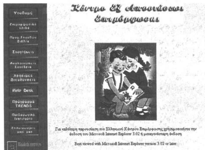
Εικόνα: Η κεντρική σελίδα του Κέντρου Εξ Αποστάσεως Επιμόρφωσης του Π.Ι