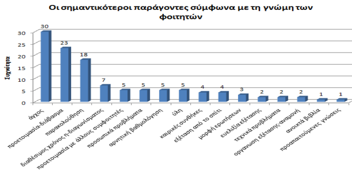
Σχήμα 2: Η γνώμη των φοιτητών για τους παράγοντες που τους επηρέασαν