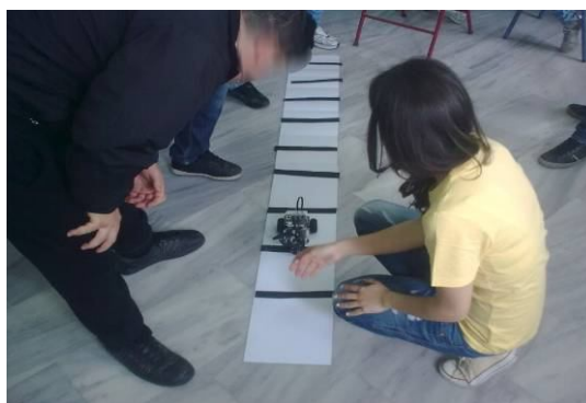
Εικόνα 6: Αριστερά η πίστα με τοποθετημένη την μία μαύρη γραμμή. – Δεξιά οι μαθητές πειραματίζονται με το όχημα στην λευκή πίστα με τοποθετημένες πολλές μαύρες γραμμές σε τυχαία σημεία.