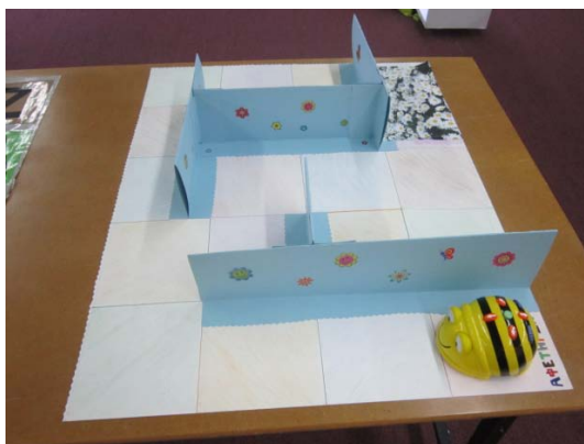
Εικόνα 2: Η δραστηριότητα με το λαβύρινθο