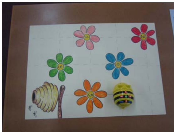
Εικόνα 1: Η δραστηριότητα με τα λουλούδια