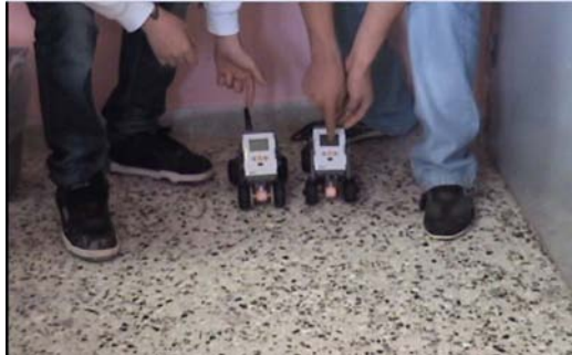
Εικόνα 2: Αγώνες ταχύτητας ανάμεσα στα αυτοκινητάκια των ομάδων.

Οι ημερήσιες δραστηριότητες τελείωσαν (ως συνήθως!) με αυτοσχέδιους αγώνες ταχύτητας μεταξύ των οχημάτων των ομάδων όπως φαίνεται στην εικόνα 2.