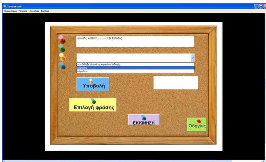
Εικόνα 2: Φράση προς συμπλήρωση και πιθανές επιλογές