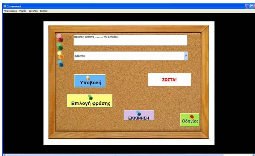
Εικόνα 3: Η «Ετικέτα» με την ένδειξη «ΣΩΣΤΑ!»

Οι πιθανές επιλογές προς συμπλήρωση που παρέχονται αποτελούνται πάντα από μία επιλογή σε ονομαστική πτώση και από μία σε κάποια από τις πλάγιες πτώσεις (δηλαδή γενική, δοτική ή αιτιατική). Η ονομαστική πτώση αντιπροσωπεύει το