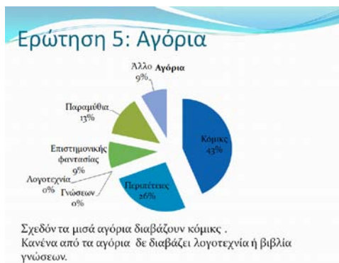
Εικόνα 3: Παράδειγμα διαφάνειας με λεζάντα μαθητών

γίνονται οι τελικές διορθώσεις και μορφοποιήσεις και η δραστηριότητα ολοκληρώνεται με την προβολή της δουλειάς των μαθητών στην τάξη.