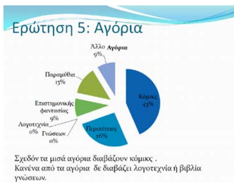
Εικόνα 3: Παράδειγμα διαφάνειας με λεζάντα μαθητών

γίνονται οι τελικές διορθώσεις και μορφοποιήσεις και η δραστηριότητα ολοκληρώνεται με την προβολή της δουλειάς των μαθητών στην τάξη.