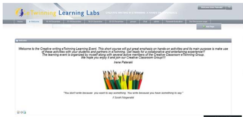
Εικόνα 2: Πλατφόρμα μαθήματος για τη Δημιουργική Γραφή

οποία έδιναν οδηγίες για τη χρήση κάποιων εργαλείων. Πρόσβαση στην πλατφόρμα του μαθήματος είχε καθ' όλη τη διάρκεια της προετοιμασίας μόνο η διαχειρίστρια, ενώ οι παραπάνω εκπαιδευτικοί προσκλήθηκαν λίγες ημέρες πριν την έναρξη του μαθήματος για να εξοικειωθούν με το χώρο και να κάνουν έναν τελικό έλεγχο (Εικόνα 2).