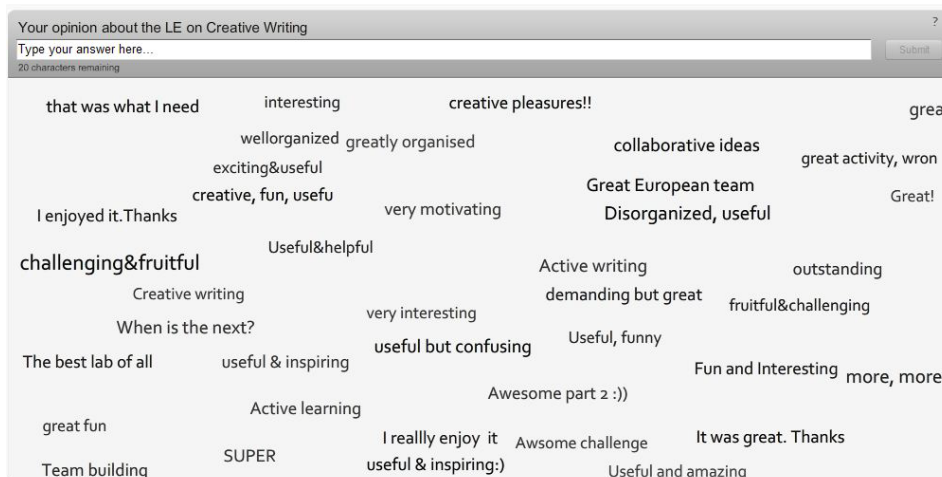
Εικόνα 3: Απόψεις εκπαιδευόμενων για το μάθημα της δημιουργικής γραφής

Η αξιολόγηση του μαθήματος έγινε ηλεκτρονικά από την Κεντρική Υπηρεσία Υποστήριξης, τα αποτελέσματα της οποίας δεν έχουν συγκεντρωθεί και επεξεργαστεί ακόμη. Παρόλα αυτά, οι εκπαιδευόμενοι, εκτός από μηνύματα στο χώρο συζήτησης, είχαν την δυνατότητα να εκφράσουν την άποψή τους για το μάθημα με 20 χαρακτήρες με τη χρήση του εργαλείου Answer Garden (Εικόνα 3)