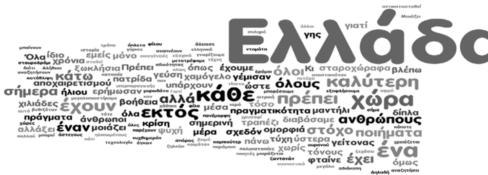
Εικόνα 3: Σύννεφο λέξεων

Στο πέμπτο στάδιο (εργασία για το σπίτι) ζητήθηκε από τους μαθητές να παράξουν λόγο ή να υλοποιήσουν μη-γλωσσικές δραστηριότητες. Κάποιοι μαθητές συνέθεσαν βίντεο με εικόνες της Ελλάδας και αντίστοιχη μουσική. Άλλοι μαθητές επέλεξαν γλωσσικές εργασίες με το εξής θέμα: «Ποια Ελλάδα έχετε στο νου σας; Σε ποια σημεία μοιάζει και σε ποια διαφέρει με την Ελλάδα των ποιημάτων που διαβάσατε;» Οι περισσότεροι μαθητές επέλεξαν να φέρουν το κείμενό τους σε ηλεκτρονική μορφή. Έτσι προέκυψε το ακόλουθο σύννεφο λέξεων (wordle):