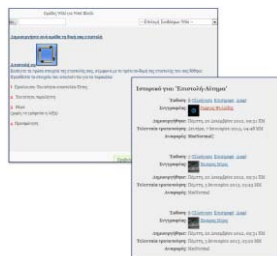
Εικόνα 2: Σελίδα του wiki – Προβολή Ιστορικού συγγραφέων.

Στο μάθημα Εφαρμογές Πολυμέσων οι μαθητές συγγράφουν το σενάριο της εφαρμογής τους συνεργατικά, στην τάξη και από απόσταση. Κάθε ομάδα έχει το δικό της χώρο στο wiki. Στην «Ειδική Θεματική Δραστηριότητα», οι μαθητές συνέγραψαν συλλογικά, ανά ομάδα, μια επιστολή-πρόσκληση, που απευθύνεται σε ελληνικές εταιρείες δημιουργίας ψηφιακών παιχνιδιών, να επισκεφθούν το σχολείο και να παρουσιάσουν τον τρόπο και τις συνθήκες εργασίας τους. Στα μαθήματα των Δικτύων I & II , οι μαθητές επεξεργάστηκαν και μορφοποίησαν συλλογικά, σε ομάδες, κείμενο (Εικόνα 2), που αναφέρεται σε βασικές αρχές Επικοινωνίας