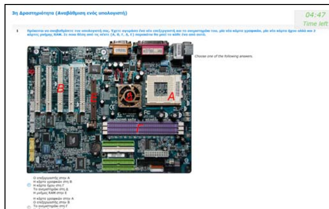
Εικόνα 3. Στιγμιότυπο 3 ης δραστηριότητας (Σύνθεση/αναβάθμιση υπολογιστή)