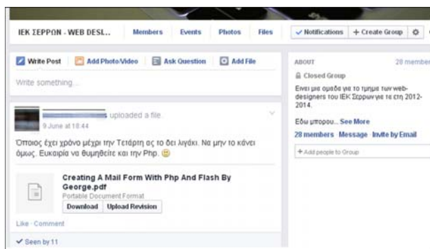
Εικόνα 1: Facebook Ομάδα του ΙΕΚ Σερρών – Web Designers 2012 - 2014