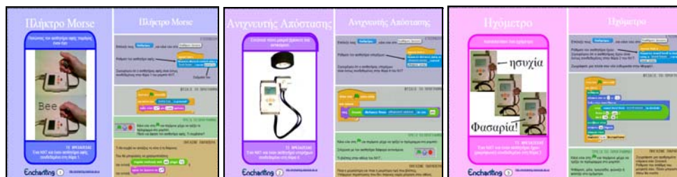
Σχήμα 2. Κάρτες εκμάθησης αισθητήρων αφής, υπερήχων και ήχου

Για την κατανόηση της λειτουργίας των αισθητήρων χρησιμοποιείται η διδακτική προσέγγιση της «Διερεύνησης». Η «Διερεύνηση» είναι μια καλά δομημένη εργαστηριακή δραστηριότητα στην οποία ο μαθητής καλείται να μελετήσει ένα μικρό πρόγραμμα, να απαντήσει σε ερωτήσεις σχετικές με τη λειτουργία του, να προβλέψει τη συμπεριφορά του και τα αποτελέσματα που θα προκύψουν και τέλος να εκτελέσει το πρόγραμμα και να συγκρίνει τα πραγματικά αποτελέσματα με τις αρχικές του προβλέψεις (Κοντόση, 2011). Στους μαθητές μοιράζονται κάρτες όπως αυτές του σχήματος 2.