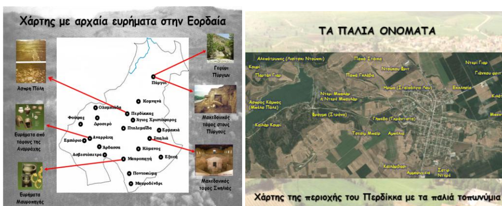
Εικόνα 2: Πρωτότυποι χάρτες των μαθητών για την τοπική ιστορία.

Σ' αυτή τη δημιουργική δραστηριότητα οι μαθητές αξιοποίησαν το ψηφιοποιημένο και αρχειοθετημένο υλικό, κάτι που τους βοήθησε να εργαστούν πιο γρήγορα και εύκολα. Ο ρόλος του καθηγητή ήταν ελάχιστα παρεμβατικός και περισσότερο καθοδηγητικός, για να επιλύσει κάποιο τεχνικό πρόβλημα, να ενθαρρύνει τα παιδιά ή να παρακινήσει ορισμένους μαθητές που δε συμμετείχαν ενεργά. Στις περισσότερες περιπτώσεις τα μέλη της ομάδας αλληλοβοηθούνταν μεταξύ τους ή ζητούσαν βοήθεια από άλλη ομάδα για απορίες ή τεχνικές δυσκολίες που αντιμετώπιζαν.