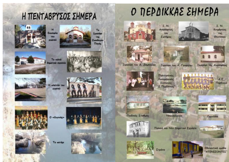
Εικόνα 1: Αφίσες των παιδιών για τα δύο χωριά.

χάρτες, για να αποτυπώσουν και να παρουσιάσουν με πλούσιο εποπτικό υλικό και μικρά συνοδευτικά κείμενα την ιστορική γνώση που κατέκτησαν κατά την έρευνα και τη συγγραφή της εργασίας. Για τη δημιουργία των παρουσιάσεων, των χαρτών και των αφισών οι μαθητές χρησιμοποίησαν τα εργαλεία του λογισμικού Microsoft Office PowerPoint και της διαδικτυακής υπηρεσίας Google Maps.