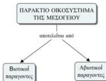
Σχήμα 1: Αρχικός χάρτης

στο (Αθανασόπουλος, 2014), στο (Θεοχαρόπουλος, 2007) ή στο (Florida Institution of Human & Machine Cognition, 2015) (στα αγγλικά).