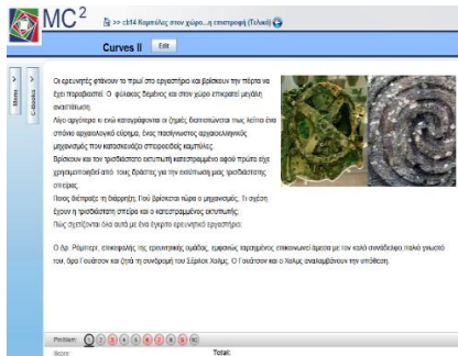
Σχήμα 1. Το περιβάλλον του mc2