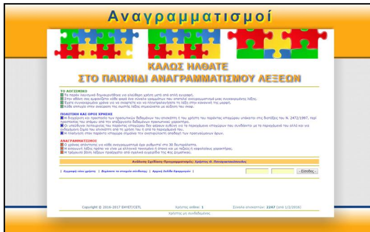
Εικόνα 1. Η εικόνα της οθόνης κατά την είσοδο στην εφαρμογή

Στην Εικόνα 1 φαίνεται η πρώτη οθόνη της εφαρμογής, όπου ο χρήστης θα πρέπει να ταυτοποιηθεί (login με όνομα και κωδικό) για να εισέλθει σ' αυτήν.