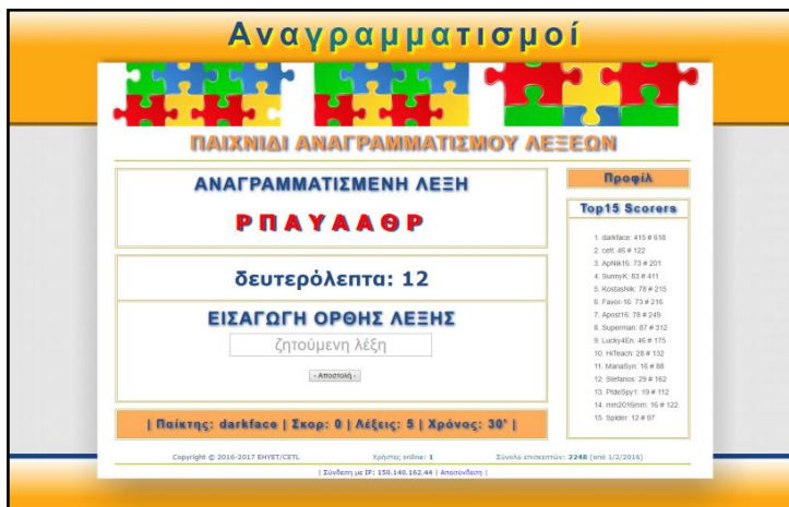
Εικόνα 2. Η εικόνα της οθόνης κατά τη λειτουργία της εφαρμογής

Μετά από την είσοδο, η εφαρμογή ξεκινά να προτείνει αναγραμματισμένες λέξεις για εύρεση των ορθών. Η μορφή της οθόνης στη φάση αυτή, φαίνεται στην Εικόνα 2.