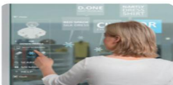
Εικόνα 3.7. Αγορές Επαυξημένης Πραγματικότητας