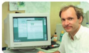
Εικόνα 11.1. Ο Tim Berners-Lee,