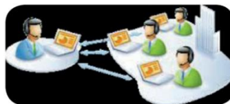
Εικόνα 14.4. Συνεργασία από απόσταση μεταξύ τηλεπραζομένων