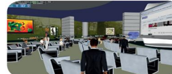
Εικόνα 14.7. Εικονικό δωμάτιο τηλεδιάσκεψης