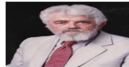
Εικόνα 3.23. Ο Τζον ΜακΚάρθυ, (John McCarthy)