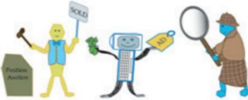
Εικόνα 3.12. Shopbots