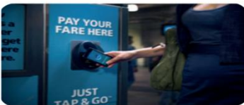
Εικόνα 3.8. Άμεση Πληρωμή Επαφής Κινητού Τηλεφώνου