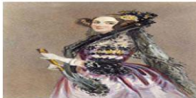
Εικόνα 2.27 Η Άντα Λάβλεϊς (Ada Lovelace), κόρη του Δόκ-