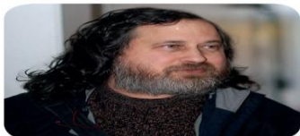
Εικόνα 2.8. Ο Ρίτσαρντ Στάλμαν είναι ο ιδρυτής του Ιδρύματος Ελεύθερου Λογισμικού.