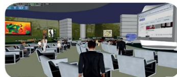
Εικόνα 14.7. Εικονικό δωμάτιο τηλεδιάσκεψης