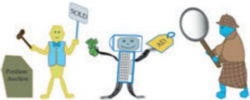
Εικόνα 3.12. Shopbots