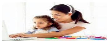
Εικόνα 14.3. Συνδυασμός επαγγελματικής και προσωπικής ζωής: