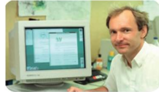
Εικόνα 11.1. Ο Tim Berners-Lee,