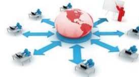
Εικόνα 12.2. Στην ηλεκτρονική μάθηση υπάρχει πρόσβαση από οπουδήποτε.