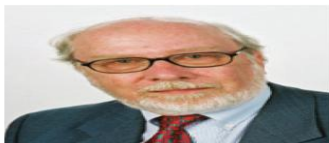
Εικόνα 2.30. Νίκλαους Βιρθ (Niklaus Wirth)