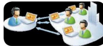
Εικόνα 14.4. Συνεργασία από απόσταση μεταξύ τηλεργαζομένων