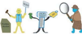
Εικόνα 3.12. Shopbots