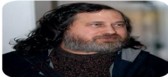
Εικόνα 2.8. Ο Ρίτσαρντ Στάλμαν είναι ο ιδρυτής του Ιδρύματος Ελεύθερου Λογισμικού.