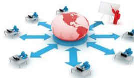
Εικόνα 12.2. Στην ηλεκτρονική μάθηση υπάρχει πρόσβαση από οπουδήποτε.