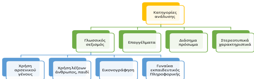
Σχήμα 1. Άξονες ανάλυσης του περιεχομένου των σχολικών εγχειριδίων Πληροφορικής

Λαμβάνοντας υπόψη την παραπάνω κατηγοριοποίηση και έχοντας υπόψη την ύλη των σχολικών εγχειριδίων πληροφορικής η ανάλυση περιεχομένου που πραγματοποιήθηκε κινήθηκε στους άξονες που απεικονίζονται στο σχήμα 1.