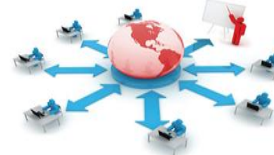
Εικόνα 12.2. Στην ηλεκτρονική μάθηση υπάρχει πρόσβαση από οπουδήποτε.