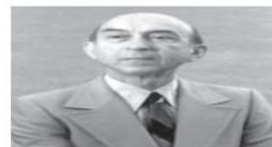
Εικόνα 3.24. Λότφι Ζάντεχ (Lotfi Zadeh).