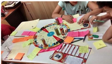
Σχήμα 4: Τα παιδιά καταγράφουν τις ιδέες τους παίζοντας το παιχνίδι

Στο τέλος του παιχνιδιού, μαζεύονται και αριθμούνται τα χαρτάκια από το ταμπλό, και διαβάζεται δυνατά κάθε ιδέα για να αξιολογηθεί από τους συμμετέχοντες σύμφωνα με 2 μεταβλητές: την χρησιμότητα και την πρωτοτυπία της. Οι συμμετέχοντες βαθμολογούν την χρησιμότητα και την πρωτοτυπία κάθε ιδέας σε πενταβάθμια κλίμακα Likert και οι συντονιστές καταγράφουν τη βαθμολογία τους.