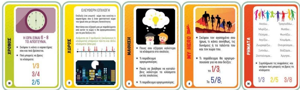
Σχήμα 3: Ενδεικτικές κάρτες του παιχνιδιού από κάθε κατηγορία

(Kowaltowski, Bianchi, & De Paiva, 2010). Οι τεχνικές αυτές συνδυάστηκαν με τους δυο άξονες διερεύνησης του σχεδιαστικού χώρου (αποκλίνουσα/συγκλίνουσα διερεύνηση και κατηγορίες μαθησιακών δυσκολιών στα κλάσματα) ώστε να δημιουργηθούν 22 κάρτες. Οι κάρτες για τη διευκόλυνση τόσο του συντονιστή όσο και των μαθητών παρουσιάστηκαν στο επιτραπέζιο παιχνίδι μέσα στις παρακάτω κατηγορίες: ΜΑΘΗΣΗ, ΧΩΡΟΣ (αγαπημένο μέρος, χώρος Superhero, ελεύθερη επιλογή χώρου), ΧΡΟΝΟΣ (πρωί, μεσημέρι, απόγευμα) ΡΗΜΑΤΑ, ΔΡΑΣΤΗΡΙΟΤΗΤΕΣ, ΧΡΩΜΑΤΑ, ΜΥ ΗΗΕΡΟ, και BREAKING THE RULES. Παραδείγματα καρτών για κάθε κατηγορία παρουσιάζονται στο επόμενο σχήμα.