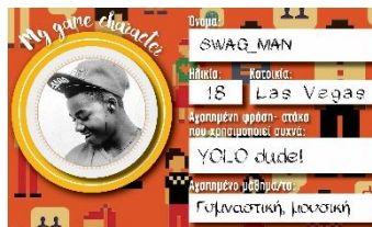
Σχήμα 2: Απόσπασμα συμπληρωμένης φόρμας για την δημιουργία του game character

Πριν ξεκινήσει το παιχνίδι, προηγήθηκε μια εισαγωγική φάση, όπου οι συντονιστές εξήγησαν στους μαθητές το αντικείμενο σχεδίασης και τους στόχους του παιχνιδιού, ενώ τους ζητήθηκε να δημιουργήσουν έναν «φανταστικό χαρακτήρα», με τον οποίο θα παίξουν στο παιχνίδι. Ο στόχος της δημιουργίας του φανταστικού χαρακτήρα ήταν να τους απελευθερώσει από το φόβο της άμεσης έκθεσης του εαυτού τους και να πυροδοτήσει την δημιουργικότητά τους (Triantafyllakos, Palaiogeorgiou & Tsoukalas, 2010). Για το σχεδιασμό του «φανταστικού χαρακτήρα» ακολουθήσαμε την τεχνική των σχεδιαστικών alter ego, που ανέπτυξαν οι Triantafyllakos et al. (2010) αφού πρώτα την προσαρμόσαμε στην ηλικία των παιδιών που συμμετείχαν. Τα παιδιά διαμόρφωσαν το προφίλ του φανταστικού χαρακτήρα πάνω σε μια έντοπη φόρμα επιλέγοντας αρχικά την εμφάνιση του χαρακτήρα τους μέσα από φωτογραφίες παιδιών της ηλικίας τους και συμπληρώνοντας τα ψυχολογικά και κοινωνικά του χαρακτηριστικά. Με την ολοκλήρωση της συμπλήρωσης της φόρμας, κάθε παιδί παρουσίασε στην υπόλοιπη ομάδα τον «χαρακτήρα» που δημιούργησε και χρησιμοποίησε την φωτογραφία του για να φτιάξει το πόνι του για το παιχνίδι. Τα παιδιά από το σημείο αυτό συμμετείχαν στο παιχνίδι με το όνομα του νέου χαρακτήρα.