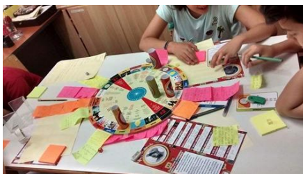
Σχήμα 4: Τα παιδιά καταγράφουν τις ιδέες τους παίζοντας το παιχνίδι

Στο τέλος του παιχνιδιού, μαζεύονται και αριθμούνται τα χαρτάκια από το ταμπλό, και διαβάζεται δυνατά κάθε ιδέα για να αξιολογηθεί από τους συμμετέχοντες σύμφωνα με 2 μεταβλητές: την χρησιμότητα και την πρωτοτυπία της. Οι συμμετέχοντες βαθμολογούν την χρησιμότητα και την πρωτοτυπία κάθε ιδέας σε πενταβάθμια κλίμακα Likert και οι συντονιστές καταγράφουν τη βαθμολογία τους.