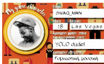
Σχήμα 2: Απόσπασμα συμπληρωμένης φόρμας για την δημιουργία του game character

Πριν ξεκινήσει το παιχνίδι, προηγήθηκε μια εισαγωγική φάση, όπου οι συντονιστές εξήγησαν στους μαθητές το αντικείμενο σχεδίασης και τους στόχους του παιχνιδιού, ενώ τους ζητήθηκε να δημιουργήσουν έναν «φανταστικό χαρακτήρα», με τον οποίο θα παίξουν στο παιχνίδι. Ο στόχος της δημιουργίας του φανταστικού χαρακτήρα ήταν να τους απελευθερώσει από το φόβο της άμεσης έκθεσης του εαυτού τους και να πυροδοτήσει την δημιουργικότητά τους (Triantafyllakos, Palaiogeorgiou & Tsoukalas, 2010). Για το σχεδιασμό του «φανταστικού χαρακτήρα» ακολουθήσαμε την τεχνική των σχεδιαστικών alter ego, που ανέπτυξαν οι Triantafyllakos et al. (2010) αφού πρώτα την προσαρμόσαμε στην ηλικία των παιδιών που συμμετείχαν. Τα παιδιά διαμόρφωσαν το προφίλ του φανταστικού χαρακτήρα πάνω σε μια έντοπη φόρμα επιλέγοντας αρχικά την εμφάνιση του χαρακτήρα τους μέσα από φωτογραφίες παιδιών της ηλικίας τους και συμπληρώνοντας τα ψυχολογικά και κοινωνικά του χαρακτηριστικά. Με την ολοκλήρωση της συμπλήρωσης της φόρμας, κάθε παιδί παρουσίασε στην υπόλοιπη ομάδα τον «χαρακτήρα» που δημιούργησε και χρησιμοποίησε την φωτογραφία του για να φτιάξει το πόνι του για το παιχνίδι. Τα παιδιά από το σημείο αυτό συμμετείχαν στο παιχνίδι με το όνομα του νέου χαρακτήρα.