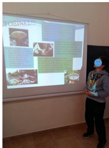
Σχήμα 3: Ψηφιακή αφίσα Στ' τάξης.