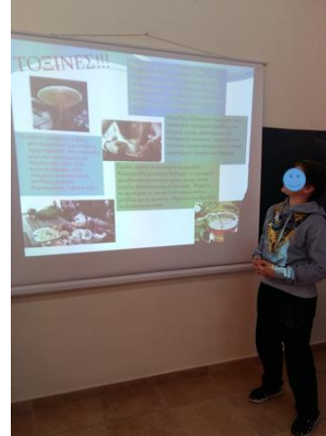
Σχήμα 3: Ψηφιακή αφίσα Στ' τάξης.