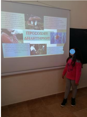
Σχήμα 2: Ψηφιακή αφίσα Ε' τάξης.

Τα μέλη της κάθε ομάδας μπορούσαν να την παρουσιάσουν από κοινού είτε να επιλέξουν έναν εκπρόσωπό τους για να κάνει την παρουσίαση (Σχήμα 2 και Σχήμα 3). Στο τέλος, μπορούσαν να απαντήσουν σε ερωτήσεις που θα έκανε το κοινό τους.