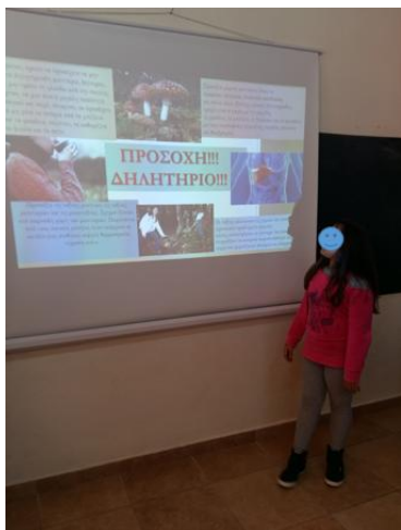
Σχήμα 2: Ψηφιακή αφίσα Ε' τάξης.

Τα μέλη της κάθε ομάδας μπορούσαν να την παρουσιάσουν από κοινού είτε να επιλέξουν έναν εκπρόσωπό τους για να κάνει την παρουσίαση (Σχήμα 2 και Σχήμα 3). Στο τέλος, μπορούσαν να απαντήσουν σε ερωτήσεις που θα έκανε το κοινό τους.