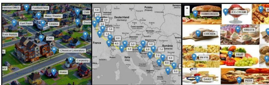
Εικόνα 4: Διαφορετικά παιχνίδια σχεδιασμένα στο ChoiCo

Το γεγονός ότι δεν υπάρχει περιορισμός στη θεματική του ψηφιακού παιχνιδιού που θα σχεδιαστεί, καθιστά το ChoiCo ένα εργαλείο κατάλληλο για τη διερεύνηση ποικίλων γνωστικών αντικειμένων. Μέχρι σήμερα έχει αξιοποιηθεί για τον σχεδιασμό εκπαιδευτικών δραστηριοτήτων που πραγματεύονται διαφορετικά μεταξύ τους θέματα (Εικόνα 4), όπως για παράδειγμα για την περιβαλλοντική εκπαίδευση και την αειφορία, για την πληροφορική, για την ισορροπημένη διατροφή αλλά και για τα αρχαία ελληνικά. Επιπλέον, χάρη στην ευκολία χρήσης των εργαλείων σχεδιασμού του παιχνιδιού, προσφέρει τη δυνατότητα να αναπτυχθούν δραστηριότητες για ένα μεγάλο ηλικιακό φάσμα μαθητών.