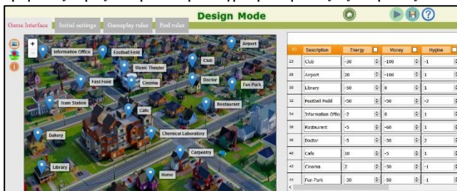
Εικόνα 2: Το περιβάλλον του ChoiCo σε λειτουργία σχεδιασμού παιχνιδιού

Στη δεύτερη καρτέλα ο σχεδιαστής ορίζει τις αρχικές συνθήκες του παιχνιδιού, τις τιμές δηλαδή με τις οποίες θα ξεκινήσει ο παίκτης. Στην τρίτη καρτέλα ορίζονται οι έλεγχοι που θα πραγματοποιούνται σε κάθε ενέργεια του παίκτη και η πιθανή απόκριση του παιχνιδιού, για παράδειγμα η εμφάνιση ενός προειδοποιητικού μηνύματος προς τον παίκτη ή η αναπαραγωγή ενός ήχου. Στη τέταρτη καρτέλα ο σχεδιαστής ορίζει τις συνθήκες τερματισμού του παιχνιδιού (π.χ. Αν τα χρήματα είναι 0 ο παίκτης χάνει). Οι τρεις τελευταίες καρτέλες προσφέρουν στον σχεδιαστή έναν χώρο για προγραμματισμό με blocks. Η λογική της διεπαφής για τον προγραμματισμό είναι παρόμοια με αντίστοιχα περιβάλλοντα όπως το Scratch, στα οποία οι χρήστες συνδυάζουν προγραμματιστικά μπλοκ από διαφορετικές κατηγορίες με σκοπό να φτιάξουν ένα πρόγραμμα (Resnick et. al, 2009). Η διαφορά των block του ChoiCo έγκειται στο γεγονός ότι είναι ειδικά διαμορφωμένα για τον προγραμματισμό των κανόνων ενός ψηφιακού παιχνιδιού. Πιο συγκεκριμένα οι κατηγορίες των block είναι χωρισμένες ανάλογα με τη λειτουργία που προσφέρουν στο παιχνίδι (block αρχικοποίησης, ενημέρωσης του χρήστη, ελέγχου συνθηκών, ροής