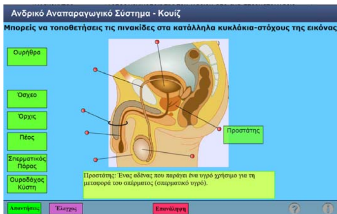
Εικόνα 5. Κοιζ για το ανδρικό αναπαραγωγικό σύστημα από το «ψηφιακό σχολείο» Δραστηριότητα 2 η

Το γυναικείο αναπαραγωγικό σύστημα αποτελείται από: την μήτρα, τις ωοθήκες, τις σάλπιγγες και τον κόλπο. Χρησιμοποίησε αυτές τις λέξεις για να συμπληρώσεις τα κενά: