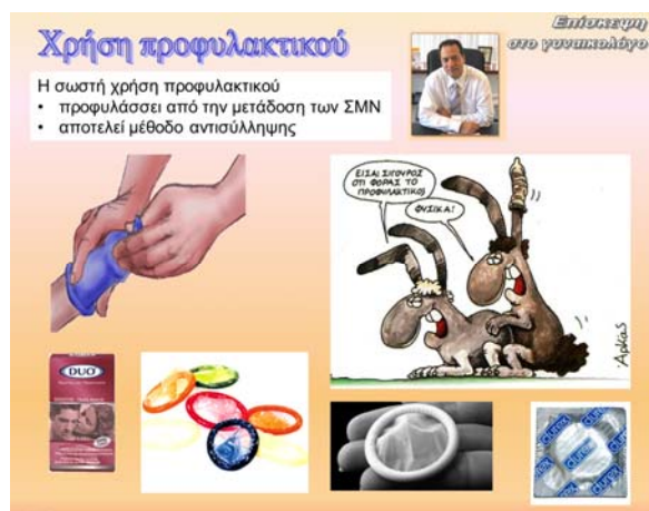
Εικόνα 3. Σεξουαλική αγωγή με το λογισμικό παρουσίασης «Επίσκεψη στο Γυναικολόγο»