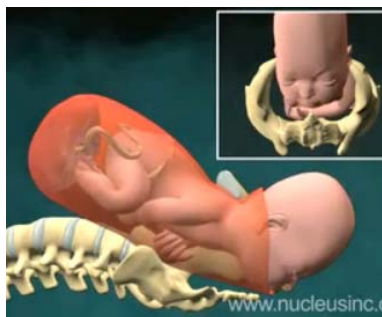
Εικόνα 4. Από το βίντεο Vaginal Childbirth