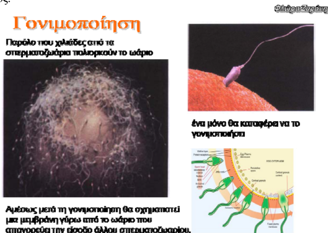
Εικόνα 2. Ενδεικτική εικόνα του λογισμικού παρουσίασης «Επίσκεψη στο Γυναικολόγο»

Έγινε προβολή του λογισμικού παρουσίασης «Επίσκεψη στον Γυναικολόγο» και της κινούμενης αναπαράστασης με τίτλο «Η γονιμοποίηση του ωαρίου» από το υλικό του ψηφιακού σχολείου. Η «ιστορία» της «Επίσκεψης» σχεδιάστηκε ως εξής: Η Μαρία, 13 ετών, βρίσκεται με τη μητέρα της, την κυρία Αλίκη, στο ιατρείο του κ. Αλεβιζάκη, γυναικολόγου. Η κυρία Αλίκη είναι έγκυος και ετοιμάζεται να εξεταστεί, ενώ ο γιατρός εξηγεί στη Μαρία πώς γίνεται η γονιμοποίηση και η δημιουργία του εμβρύου. Οι ενότητες που διαπραγματεύεται η παρουσίαση είναι: σεξουαλική επαφή, γονιμοποίηση (εικόνα 2), η ανάπτυξη του εμβρύου - εγκυμοσύνη, υπερηχογράφημα, το έμβρυο μεγαλώνει στη μήτρα, το έμβρυο συνδέεται με την μητέρα του, εγκυμοσύνη και υγεία, ο τοκετός, το νεογέννητο βρέφος, θηλασμός.