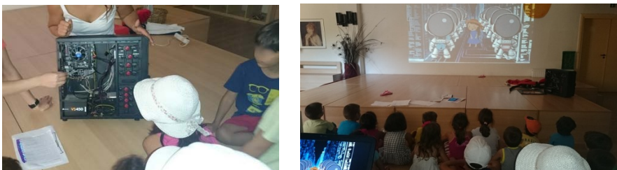
Σχήμα 2. Τα παιδιά βλέπουν πραγματικό υπολογιστή και την ψηφιακή ιστορία

Η Φάση Β ήταν καθαρά διδακτική και περιλάμβανε επίσης δύο δραστηριότητες. Η Δραστηριότητα 1 διήρκεσε περίπου 45 λεπτά και περιλάμβανε την προβολή και ανάλυση της ψηφιακής ιστορίας με τίτλο «Η Πληροφορία στο Μαγικό Κόσμο του Υπολογιστή» (Σχήμα 2 δεξιά) που δημιουργήθηκε για τις ανάγκες της έρευνας, ώστε να οδηγηθούν τα