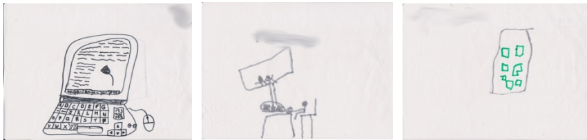
Σχήμα 1. Εικαστικές αναπαραστάσεις υπολογιστικών συστημάτων από τα παιδιά

κατανέμονταν σε 7 προνήπια, 9 νήπια και 4 πήγαιναν στο δημοτικό. Συγκεκριμένα, ένα κορίτσι στη δεύτερα, δύο κορίτσια στην τρίτη και ένα αγόρι στην πέμπτη δημοτικού. Τη συγκεκριμένη περίοδο βρίσκονταν εκεί για φύλαξη και στο παρελθόν ήταν μαθητές του συγκεκριμένου ιδιωτικού Νηπιαγωγείου.