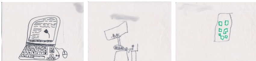
Σχήμα 1. Εικαστικές αναπαραστάσεις υπολογιστικών συστημάτων από τα παιδιά

κατανέμονταν σε 7 προνήπια, 9 νήπια και 4 πήγαιναν στο δημοτικό. Συγκεκριμένα, ένα κορίτσι στη δεύτερα, δύο κορίτσια στην τρίτη και ένα αγόρι στην πέμπτη δημοτικού. Τη συγκεκριμένη περίοδο βρίσκονταν εκεί για φύλαξη και στο παρελθόν ήταν μαθητές του συγκεκριμένου ιδιωτικού Νηπιαγωγείου.