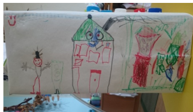
Σχήμα 3. Κατασκευαστικές αναπαραστάσεις Η/Υ από τα παιδιά