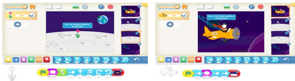
Σχήμα 3. Απόδοση του Μικρού Πρίγκιπα στο ScratchJr από τους μεγαλύτερους μαθητές

θέλουν περισσότερο και να προσπαθήσουν να αποδώσουν την ιστορία τους στο ScratchJr. Τα παιδιά προβληματίστηκαν αρκετά, μελέτησαν τα βιβλία και τελικά επέλεξαν να φτιάξουν μια ιστορία με τον “Μικρό Πρίγκιπα”. Όταν ρωτήθηκαν για ποιο λόγο επέλεξαν το συγκεκριμένο βιβλίο απάντησαν ότι το είχαν διαβάσει πολλές φορές στο σχολείο και το γνώριζαν καλά. Στο Σχήμα 3 φαίνονται στιγμιότυπα από την ιστορία τους. Όλα αυτά, όμως, πραγματοποιήθηκαν αφού, τις προηγούμενες μέρες, είχαν παίξει το παιχνίδι Προγραμματισμού κι είχαν μάθει τις βασικές εντολές Προγραμματισμού.