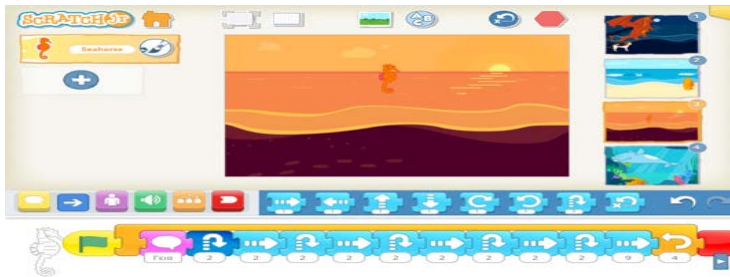
Σχήμα 2. Εφαρμογή εντολής επανάληψης στο ScratchJr

το παιχνίδι, κανένα από αυτά δεν εγκατέλειψε την προσπάθεια για να κατανοήσει την εντολή επανάληψης και να φτάσει στην ολοκλήρωση του επιπέδου. Μετά το παιχνίδι και την κατανόηση της εντολής επανάληψης τα παιδιά πήγαν πάλι στο ScratchJr και αυτή τη φορά επέλεξαν μόνο τους να χρησιμοποιήσουν την εντολή της επανάληψης με σχόλια “είναι πιο εύκολη”, “τη βάζω μία φορά και παίζει συνέχεια”, “έχει πλάκα τελικά”. Στο Σχήμα 2 φαίνεται η χρήση της εντολής επανάληψης από τους μικρότερους μαθητές του δείγματος, αφού πρώτα την είχαν μάθει στο παιχνίδι.