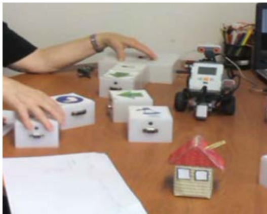
Σχήμα 1. Ασκήσεις Εκπαιδευτικής Ρομποτικής των ασθενών

Για τους σκοπούς της παρούσας έρευνας χρησιμοποιήθηκε ένα υποσύστημα της πλατφόρμας PROTEAS (PROgramming Tangible Activity System) η οποία είναι μια ολοκληρωμένη πλατφόρμα εκμάθησης και εξοικείωσης με τον προγραμματισμό. Για τους σκοπούς της παρούσας έρευνας χρησιμοποιήθηκε το υποσύστημα απτικού (TUI) προγραμματισμού (T_ProRob) το οποίο προγραμματίζει ένα Lego Mindstorms NXT ρομπότ χρησιμοποιώντας κώβους (Sapounidis & Demetriadis, 2011; Sapounidis & Demetriadis, 2013).